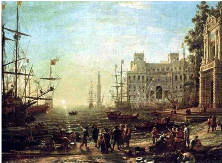
Figure : Seaport, Lorrain (1638)

Entorno económico, político y social Mercantilismo Periodo de transición: Cantillon Conclusiones Más allá: Paradoja de Condorcet