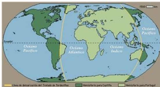
Figure : El Papa Alejandro VI dividió al mundo con el Tratado de Tordesillas en 1494